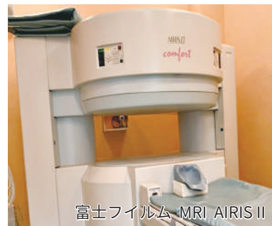
富士フィルム MRI AIRIS II

リハビリテーション科には、理学療法士と作業療法士が在籍し、理学療法は寝返り、起き上がり、歩くことを目標として、主に運動を実施します。また、痛みのある場合は、物理療法を行います。作業療法は、身辺動作、トイレ動作などの獲得を目標として、作業を利用し、治療を行います。