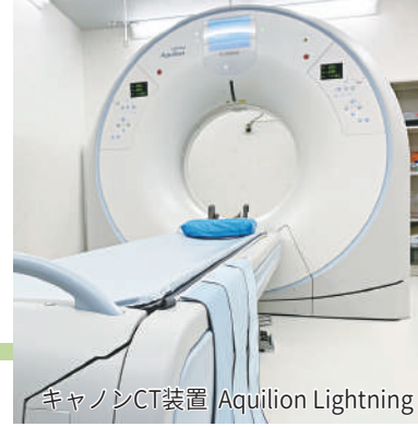
キャノンCT装置 Aquilion Lightning