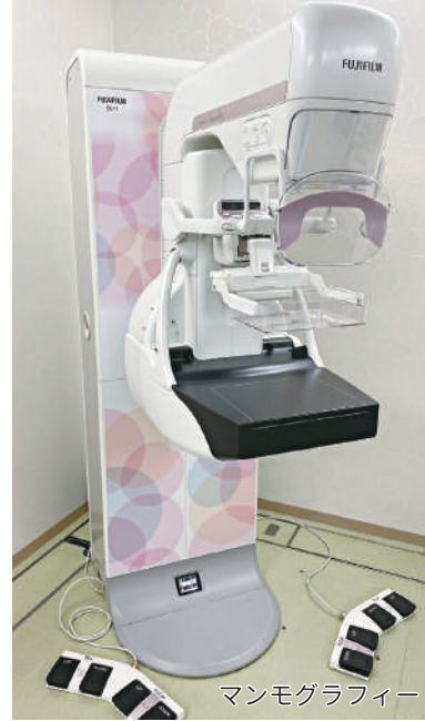
マンモグラフィー

当院ではリウマチ・膠原病性疾患を内科的なアプローチから診察しています。代表的な疾患は関節リウマチです。